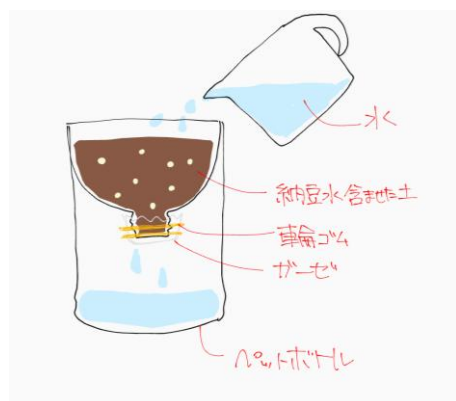
図1 保水力を確かめるための装置