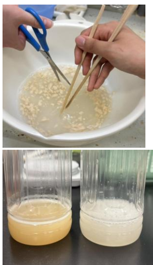
↑ 左が納豆水、右が PGA 溶液